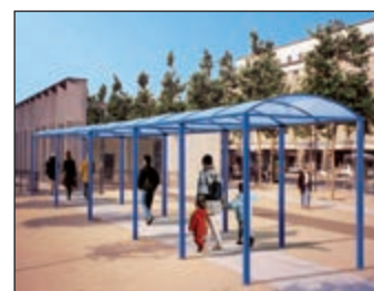
Varianta použití - krytý průchod.