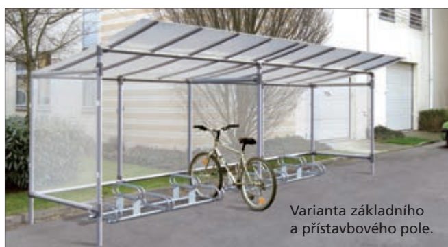
Varianta základního a přístavbového pole.